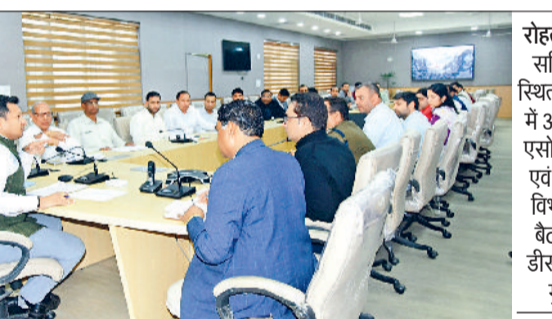
रोहतक। लघु सचिवालय स्थित सभागार में औद्योगिक एसोसिएशनों एवं संबंधित विभागों की बैठक लेते डीसी सचिन गुप्ता।

लघु सचिवालय स्थित सभागार में हुई औद्योगिक एसोसिएशनों एवं संबंधित विभागों की बैठक