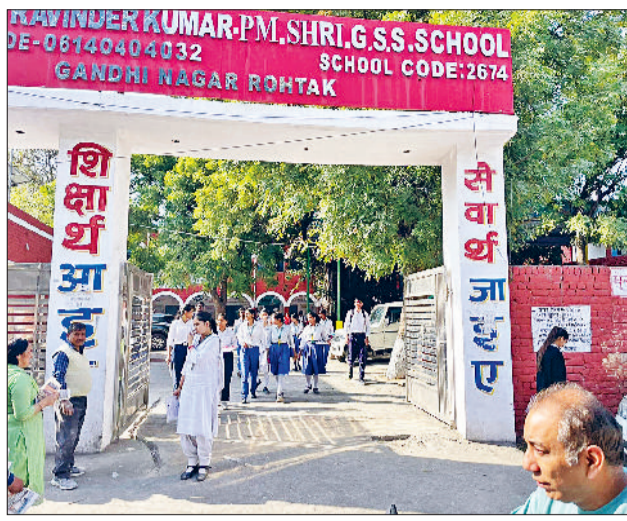
रोहतक। परीक्षा केंद्र से बाहर आते विद्यार्थी।