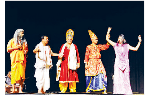
रोहतक। नाटक प्रस्तुत करते कलाकार।

समस्या से निजात मिलेगी। कैबिनेट मंत्री श्रुति चौधरी ने माना कि महम हलके में पिछले लंबे समय से ड्रेनेज और बरसाती पानी निकासी के स्थाई समाधान किया है। जिस तरह से मंत्री ने जानकारी दी है उससे लगता है कि यदि जल्द ही इन योजनाओं पर काम शुरू किया गया तो लोगों को जलभराव की