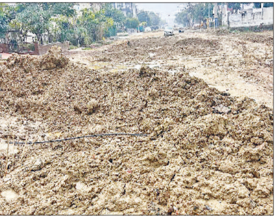
रोहतक। सीएम से मिलने पर शुरू हुआ था कार्य, सेक्टर-4 एक्सटेंशन में 600 मीटर सीवर लाइन अटकी।

कई जगह मैनहोल खुले पड़े, इससे दुर्घटना का खतरा बना हुआ है और गंदे पानी की निकासी नहीं हो पा रही