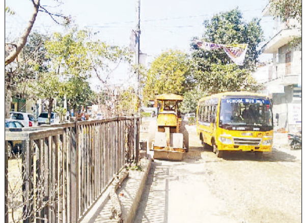
रोहतक। निर्माण कार्य के लिए आई मशीनें।