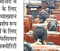
महिला कॉलेज में ए.आई. व साइबर सिक्योरिटी पर व्याख्यान।

रोहताक। कार्यक्रम को समर्थित करते मुख्य वक्ता।